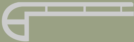
Flush stair nose A 2400x72x25mm Escalón empotrado A 2400x72x25mm