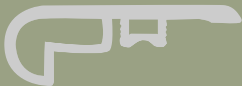
Stair nose 2400x58x18mm Peldaño 2400x58x18mm