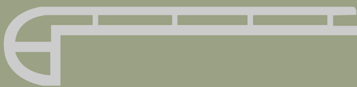
Flush stair nose B 2400x115x25mm Escalón empotrado B 2400x115x25mm