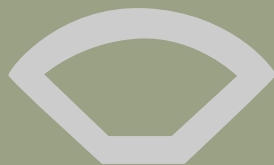
Quarter round 2400x28x16mm Cuarto de circunferencia 2400x28x16mm