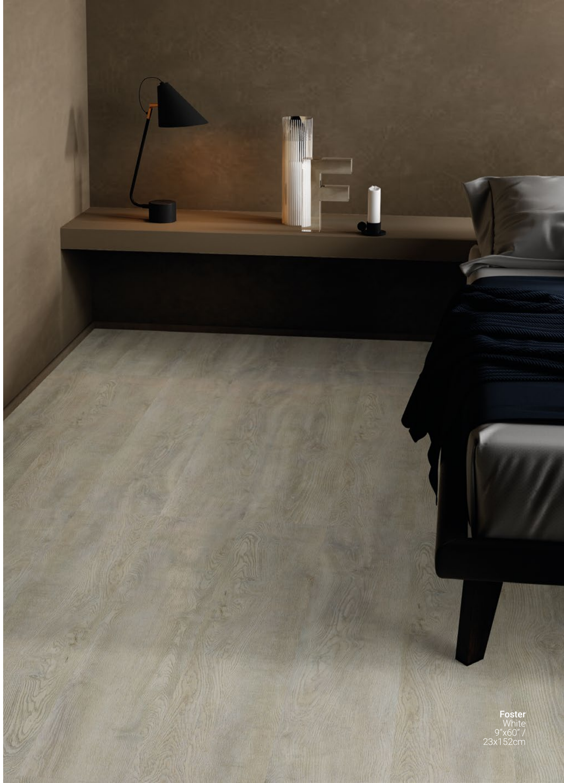
Foster White 9"x60" / 23x152cm