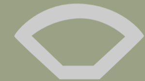
Quarter round 2400x28x16mm Cuarto de circunferencia 2400x28x16mm